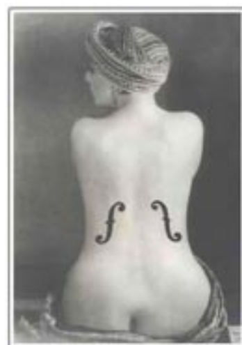
Man Ray , Violon d'Ingres , 1924

Uit deze laatste bloem of deugd blijkt direct de vereniging tussen Eros en Agapè . Ten opzichte van het Manicheïsme, waar we de eerste vereniging tussen Eros en Agapè hebben beschreven, is hier bij Parcival een sterkere vorm van vereniging, omdat de fysieke liefde tot de geliefde geïntegreerd wordt in de ontwikkeling van de Agapè tot de mensheid. Hierdoor kan ook de seksualiteit worden getransformeerd of met zuivere geestelijke liefde doordrongen worden. De relatie van de man tot de vrouw was evenwel in de cultuur van de hoofse minne niet gelijkwaardig, maar asymmetrisch. De hoofse minne staat als antithese in een dialectische verhouding met de vóór-hoofse minne als these en herstelt de onderwerping van de vrouw door de dienstbaarheid aan de vrouw. Daardoor wordt de vrouw en het 'Eeuwig vrouwelijke' in de vrouw - ongelijkwaardig ten opzichte van de vrouw naar de man - aanbeden.