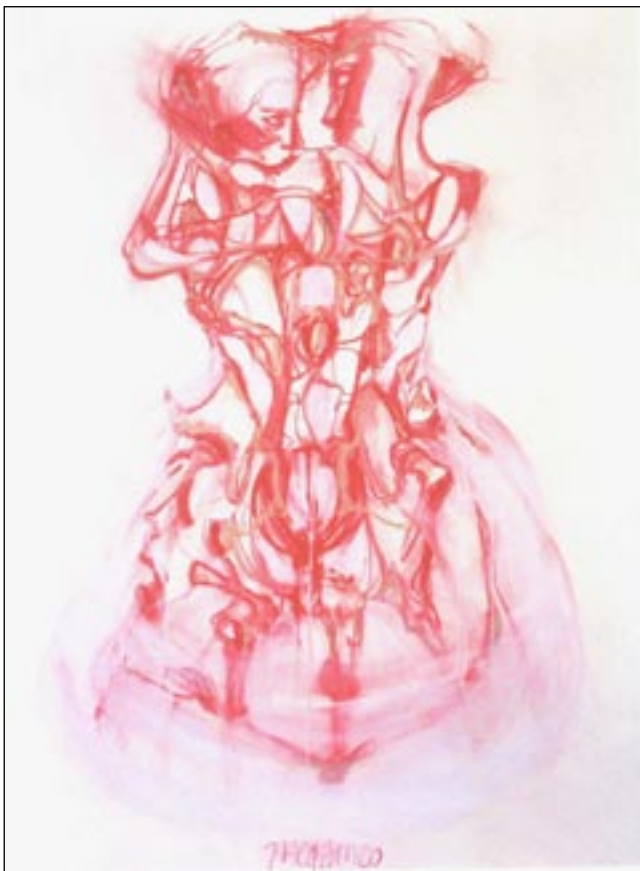
Jacquem, Syzygische relatie , 2002 ( www.jacquem.nl )