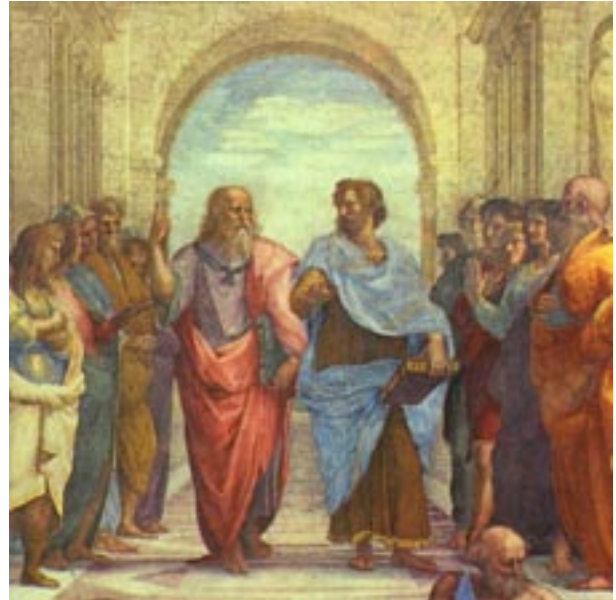
Plato en Aristoteles op de School van Athene van Rafaël

Plato heeft in twee dialogen uitgebreid gesproken over de liefde in de vorm van Eros: in de Symposium en in de Phaedrus. In de Symposium zegt Phaedrus dat Eros de oudste godheid is, die diegene die de ander liefheeft kan inspireren en Pausanias zegt dat er een aardse en hemelse Eros is, waarbij de eerste zich op het vergankelijke lichaam richt en de tweede de hogere liefde is voor de onvergankelijke schoonheid van de geest. Volgens Eryximachus, die is gaan spreken in de tijd van Aristophanes die door de hik uit het veld geslagen is, is de liefde – Eros nog overvleugelend – de eenheid van de hele kosmos. Aristophanes vertelt dan dat de Eros het verlangen is zich te verenigen met de wederhelft van wie men in de oertijd gescheiden is geraakt. Socrates zegt dan dat hij van de priesteres Diotima heeft geleerd dat Eros (behalve overvloed) de armoede is die streeft naar het schone, de wijsheid en het goede. De minnaar streeft naar de onsterfelijkheid. De weg van de minnaars zal zijn dat zij overgaan van de schoonheid van het lichaam op de schoonheid van de ziel en opstijgen tot de zuivere Idee van de schoonheid zelve. Door dit inzicht van de minnaar, die in de filosofie en de kunst de geestelijke schoonheid zoekt, zal de deugd kunnen ontstaan en daardoor de onsterfelijkheid. Minnen betekent dat men onsterfelijkheid voortbrengt in schoonheid.