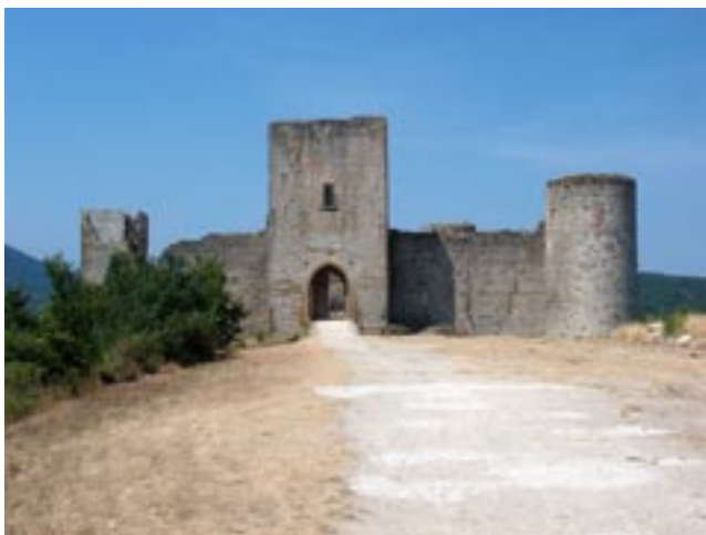
Het kasteel Puivert in het Katharengedebied van Zuid-Frankrijk, centrum van de troubadours en de hoofse minne in de vroege Middeleeuwen.

In de middeleeuwse cultuur van de hoofse minne, die in Zuid-Frankrijk in Occitanië, 22 met name in Puivert, binnen de cultuur van het Katharisme, als een middeleeuwse vorm van Manicheïsme, 23 tot ontwikkeling kwam, werd de liefde van de man tot de domna of de adellijke vrouw centraal gesteld, dat in zijn platonische – dat is hier aseksuele - vorm ook als buitenechtelijke relatie werd toegelaten.